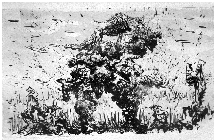
Droga Wojownika | 2019 | litografia, 80 × 50 cm | Grzegorz Bugaj

To, czego nie można nazwać ani zdefiniować, było przedmiotem zainteresowania wielu nurtów – od sztuki sumeryjskiej, przez sztukę sakralną, mistyczną ikonografię, średniowieczną symbolikę, aż po romantyzm i surrealizm. Niewiadome pojawia się w każdej twórczości i jest częścią dzieła tak jak każdy inny element. Nawet w pracach czysto figuratywnych ma swoje